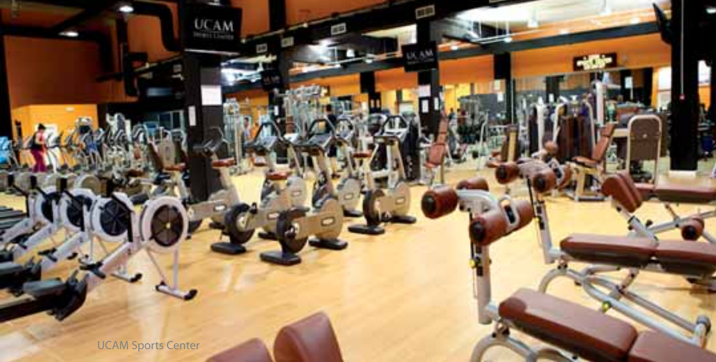
UCAM Sports Center