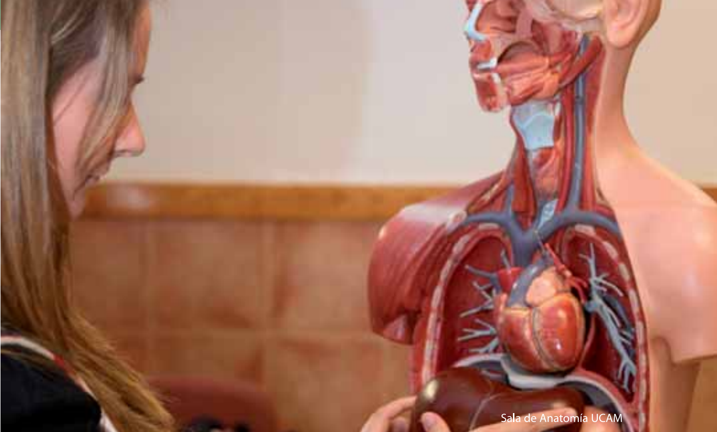
Sala de Anatomía UCAM