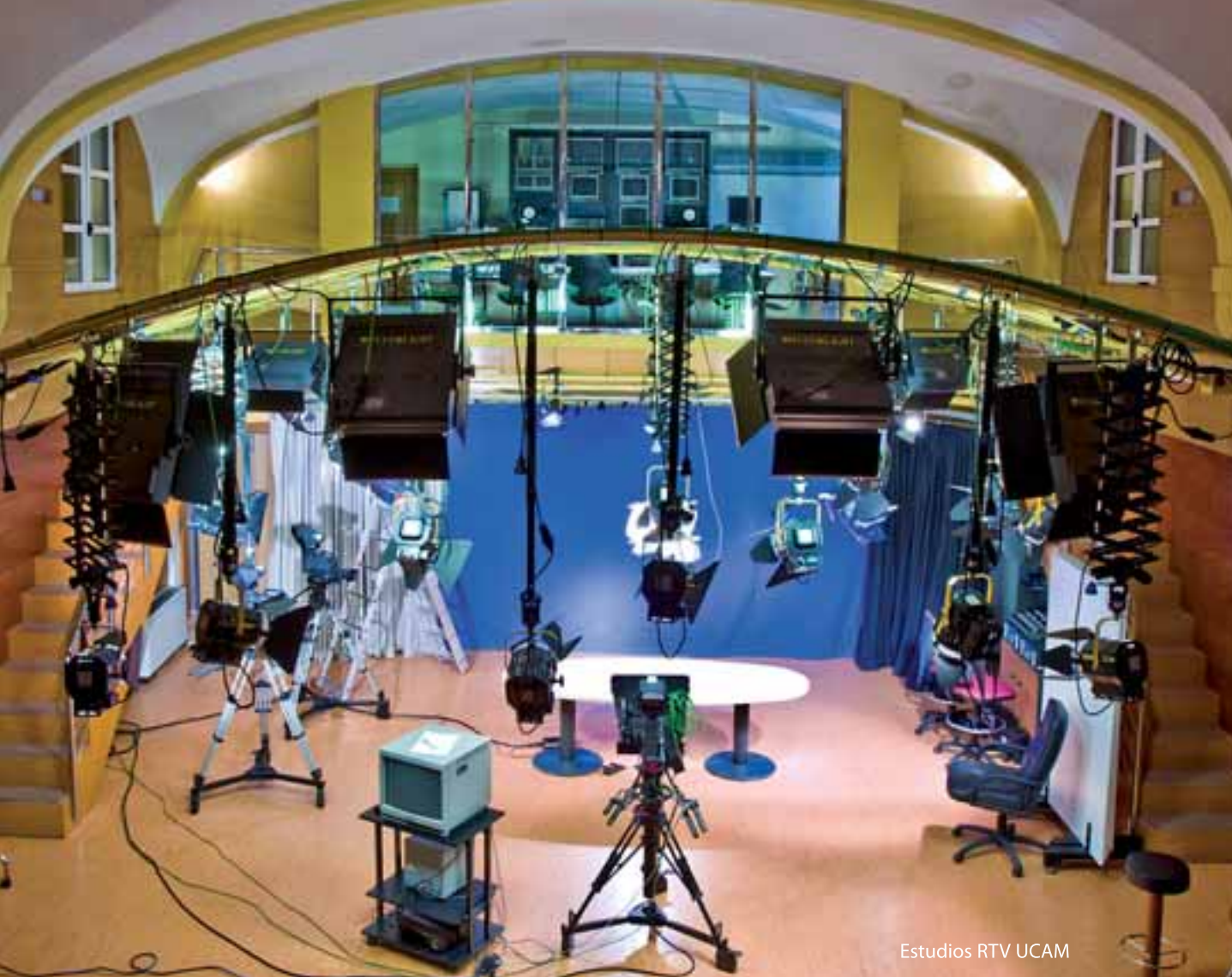
Estudios RTV UCAM