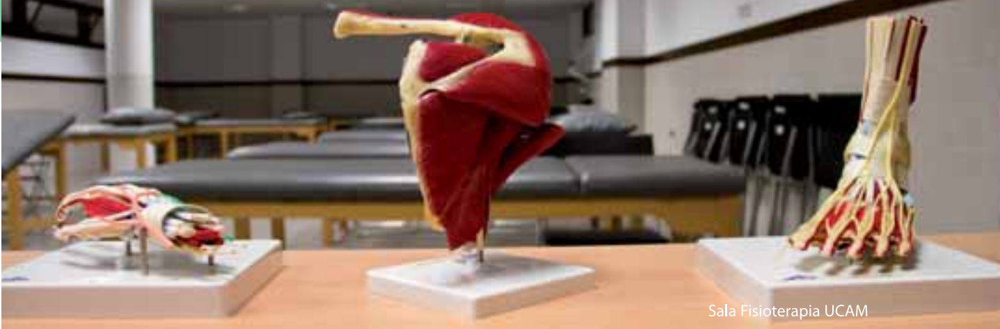
Sala Fisioterapia UCAM